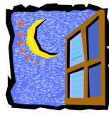
Before Sleeping よる、ねるまえ