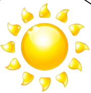
When Waking Up あさ、おきるとき