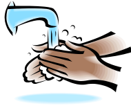
Leaving the Toilet トイレをでるとき