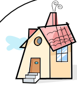
Entering the Home いえにはいるとき