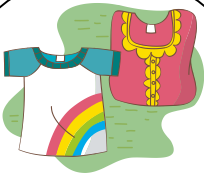
When Dressing ふくをきるとき