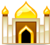
Entering the Masjid マスジドにはいるとき