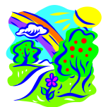
After Rainfall あめがやんだあと