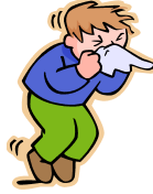
After Sneezing くしゃみのあと