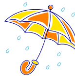
When It Rains あめがふるとき